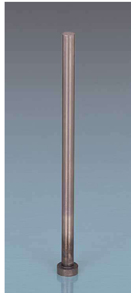
N 277. Auswerferstift, Form A

Bestellbeispiel: N277.0800.160 Auswerferstift, nitriert, blank Form A Durchmesser d1 = 8,0 mm, Länge L = 160 mm