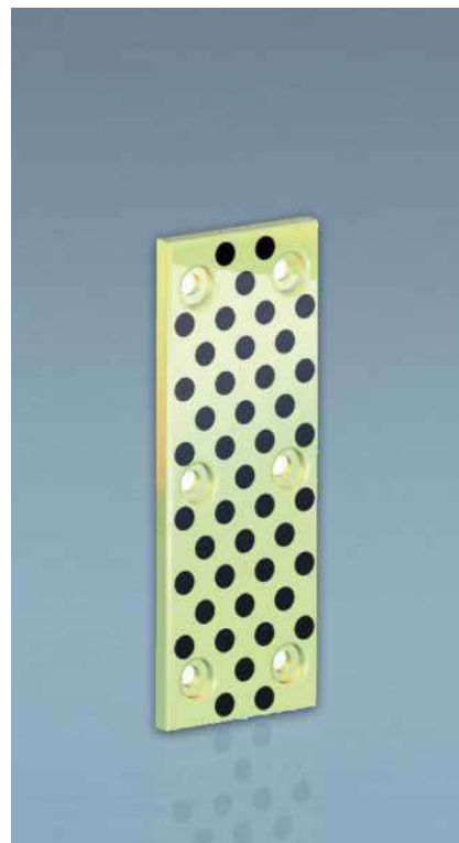
Tabelle zu 5133.