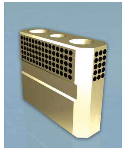
Tabelle zu 5176.

5176.080.35 Verriegelung L = 80,0 mm b = 35,0 mm