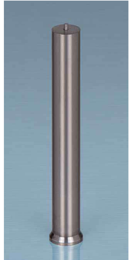
Tabelle zu 112.