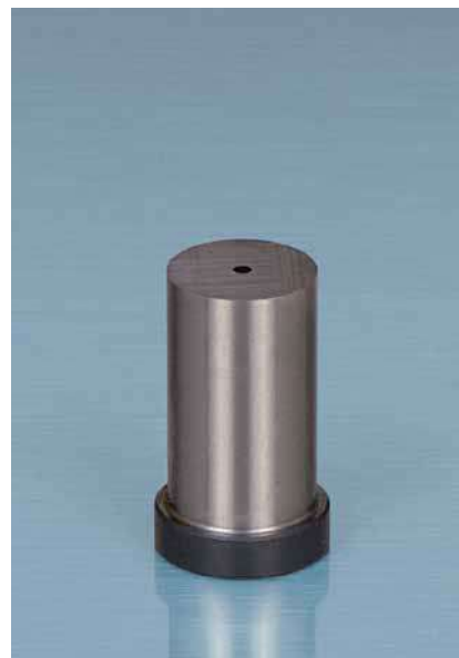
Tabelle zu D8977.