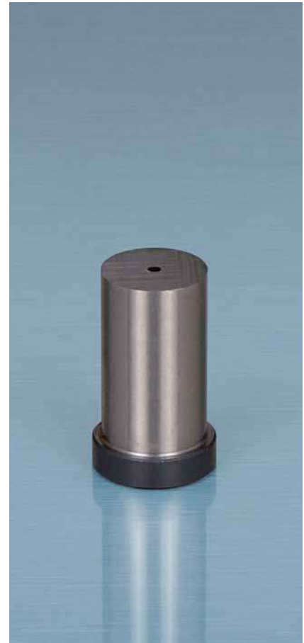
Tabelle zu F8977.