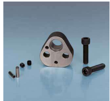
Tabelle zu ART.

ART.10 Stempelhalteplatten Typ ART ART 10