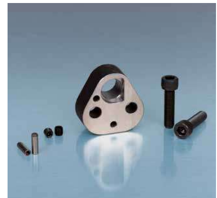
Tabelle zu ARTS.

ARTS.10 Stempelhalteplatten Typ ARTS ARTS 10